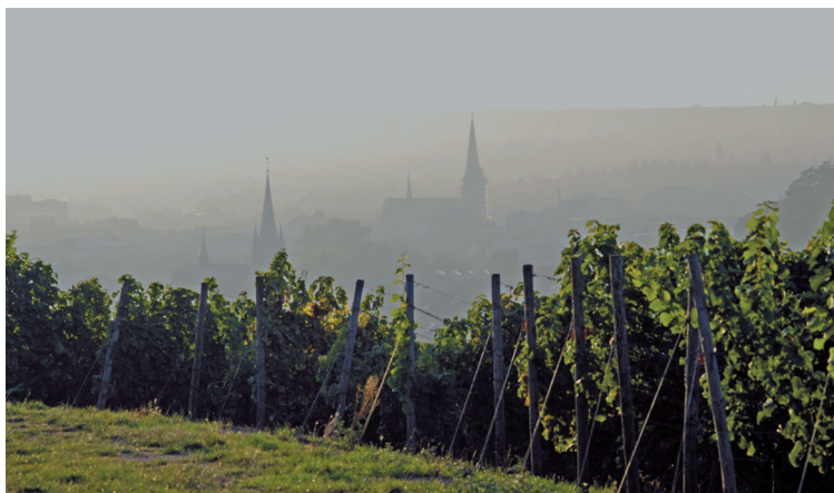
Blick vom Kreuznacher Kahlenberg