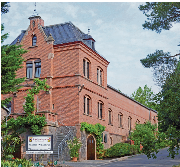
Gründergebäude von 1900

Besuchen Sie unseren Weinshop im Internet unter www.staatsweingut.de